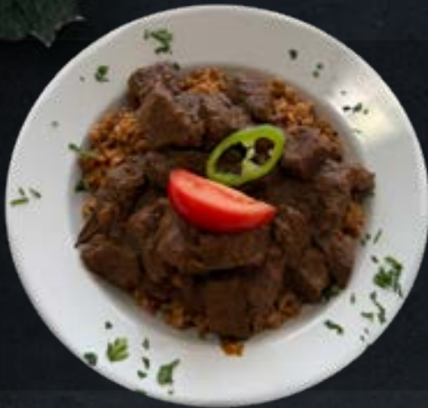
Marhapörkölt tarhonyával Beef stew with pasta (1,3,5,7)