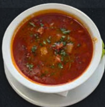
Babgulyás Bean Goulash (1,3,9)