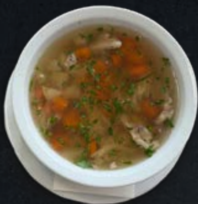
Tyúkhúsleves csigatésztával Chicken noodle soup (1,3,5,7,9)