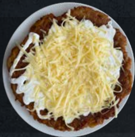
Sajos tejfölös lapcsánka Hungarian hash browns with sour sauce and cheese (1,3,7)